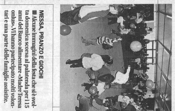
MESSA, PRANZO E GIOCHI ■ Alcune immagini della festa che si è svolta domenica scorsa al palatenda per i 15 anni del Banco alimentare «Madre Teresa onlus». Vi hanno partecipato molti volontari e una parte delle famiglie assistite.